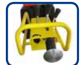
Nouveau: Plaque de pousser d'arrêt en acier