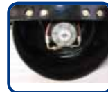
Moteur hydraulique SAUER DANFOSS