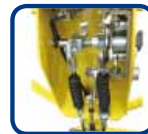
Arrêt et commande de sécurité améliorée.